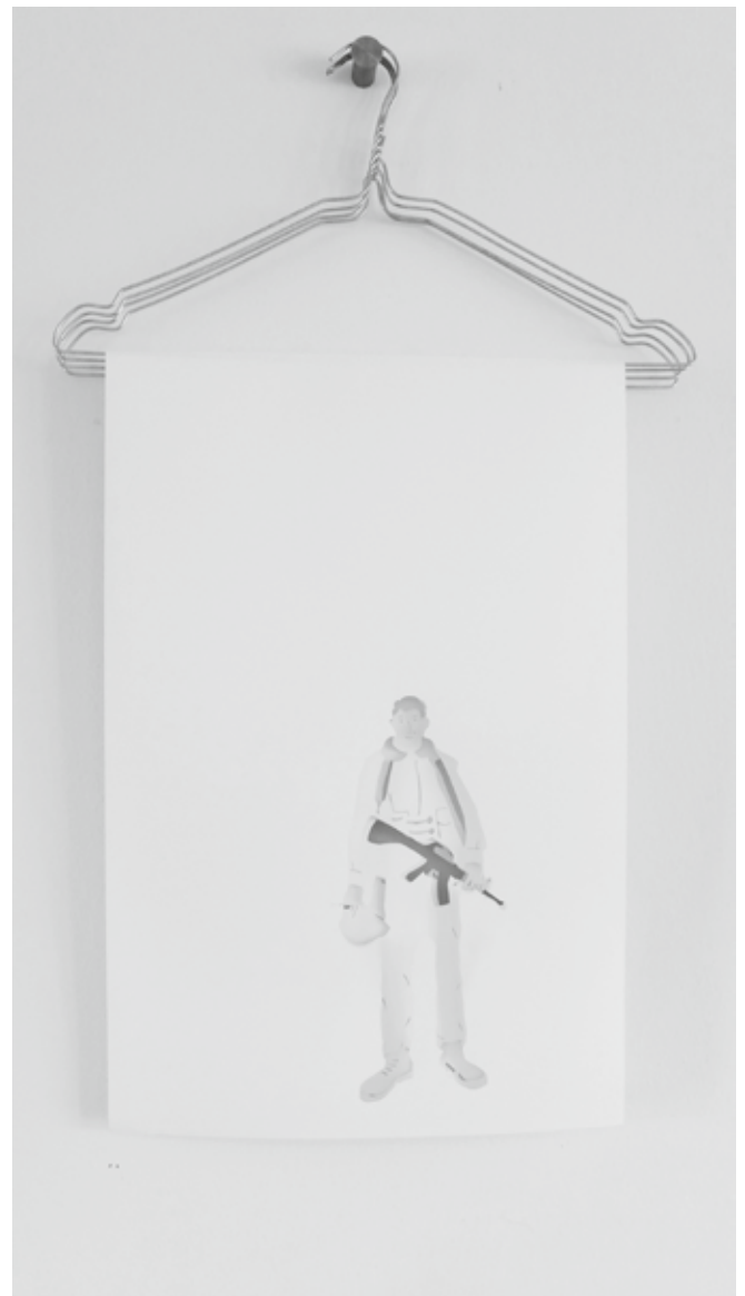
Daphna Weinstein, The (First) Paper Brigade, Israeli Soldier, 2008.