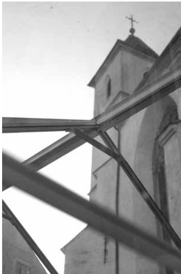
RESANITA, CAMP (Detail), 2013.

Heimat als Tiefe und als Weite kann auch über dem Portal des neuen Quartier Leech stehen, der Heimat der Katholischen Hochschulgemeinde und des Afro-Asiatischen Instituts. Der Name erinnert an das Quartier Latin . Dieses Pariser Viertel war ein Brennpunkt der Entstehung der Universitas . Universitäten entwickelten sich dort vor allem durch die kreative Vernetzung von Kollegien für Studierende verschiedener Länder und Disziplinen, darunter besonders auch der Theologie, und den Diskurs mit Lehrenden. Die vielen kirchlichen Kollegiaten standen dabei immer in der Spannung zwischen Glaube und Wissenschaft. Mit beiden befasst sich der Mensch in je unterschiedlicher Form. Papst Benedikt XVI. hat dazu 2008 im Collège des Bernardins , dem ehemaligen Zisterzienserkolleg, aus katholischer Sicht gesagt: „Das Verlangen nach Gott, der désir de Dieu , schließt den amour des lettres ,