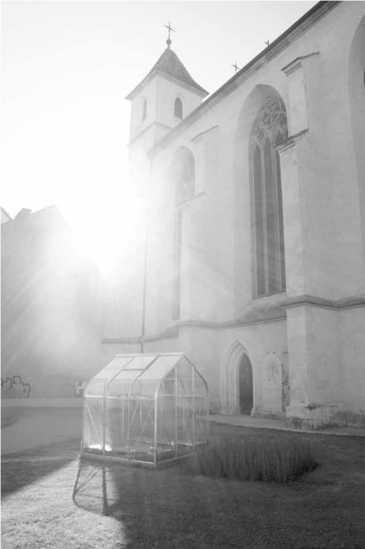
RESANITA, CAMP, 2013.