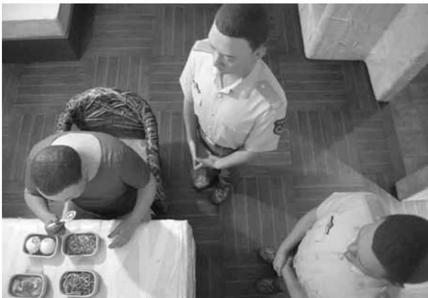
Ai Weiwei, S.A.C.R.E.D., Installation in Sant'Antonin (Venedig)/Detail, 2013.