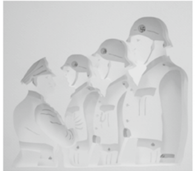
Daphna Weinstein, The (First) Paper Brigade, SS (Detail), 2008. © Weinstein