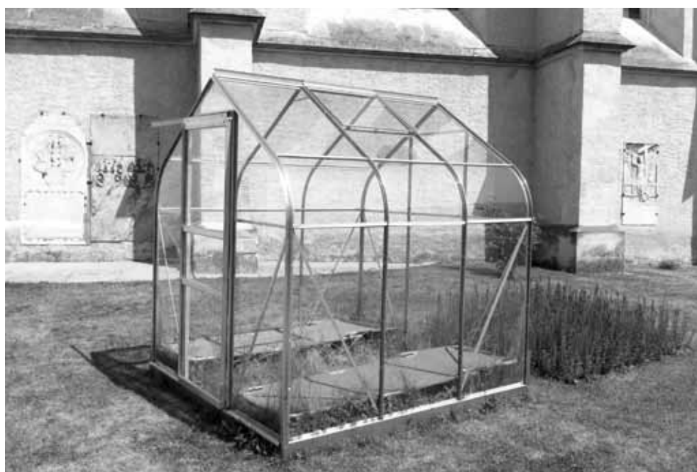
RESANITA, CAMP, 2013.

Heimat steht für viele Menschen in engem Zusammenhang mit Identität und Lebensraum – einerseits in seiner sozialen Dimension im Hinblick auf Menschen und Bräuche, andererseits aus dem geografischen Blickwinkel heraus, wo prägende Orte und Symbole eine wesentliche Komponente für die Definition von Heimat darstellen. In der Europäischen Union nimmt die Förderung kultureller Vielfalt und die Bewahrung von Kulturerbe einen wichtigen Platz ein. Die EU-BürgerInnen selbst stehen dabei im Mittelpunkt, denn nur durch ihr Interesse und die Bemühungen, dass ihre besonderen Bräuche und Traditionen nicht verblassen, kann dieses breite Spektrum und Angebot, das für Europa so charakteristisch ist, auch weiterhin bestehen.