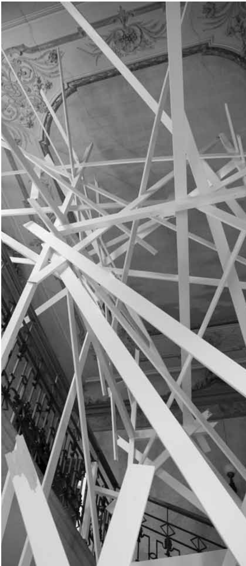
How to disappear completely (Installation im Palazzo Papadopoli, Venedig / Detail), 2011.

gegeben, die meinten, in dem niedrigen Raum dürfte man die Decke nicht noch weiter herunterholen. Wie siehst du das?