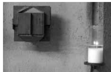
Gerhardt Moswitzer, Tabernakel, 1964/65.

Am 19. März 2012 ist der Künstler Gerhardt Moswitzer nach schwerer Krankheit im Alter von 72 Jahren verstorben. Er gehörte zu den bedeutendsten österreichischen Künstlern. Bereits 1970 hat er Österreich auf der Biennale von Venedig vertreten, zuvor hatte er mit der Gestaltung von Kreuz und Tabernakel für die Hauskapelle in der Leechgasse 24 und einer Außenraum-Skulptur schon wesentliche Werke für die KHG Graz geschaffen. Schon seit einigen Jahren hatte er sich allerdings von der Schaffung von Eisenskulpturen, mit denen er Berühmtheit erlangt hatte, abgewandt und sich mit experimenteller Musik und Video beschäftigt. In Kooperation mit der Akademie Graz und dem Universal-museum Joanneum lädt die Kath. Hochschulgemeinde am 12. NOV um 19:00 zu einer Gedenkveranstaltung in die Neue Galerie, Kalchberggasse 4. Neben einem filmischen