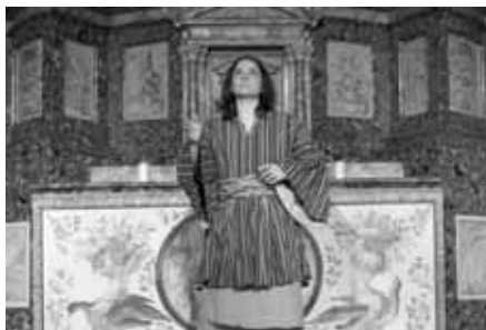
Die SolistInnen im Grazer Mausoleum