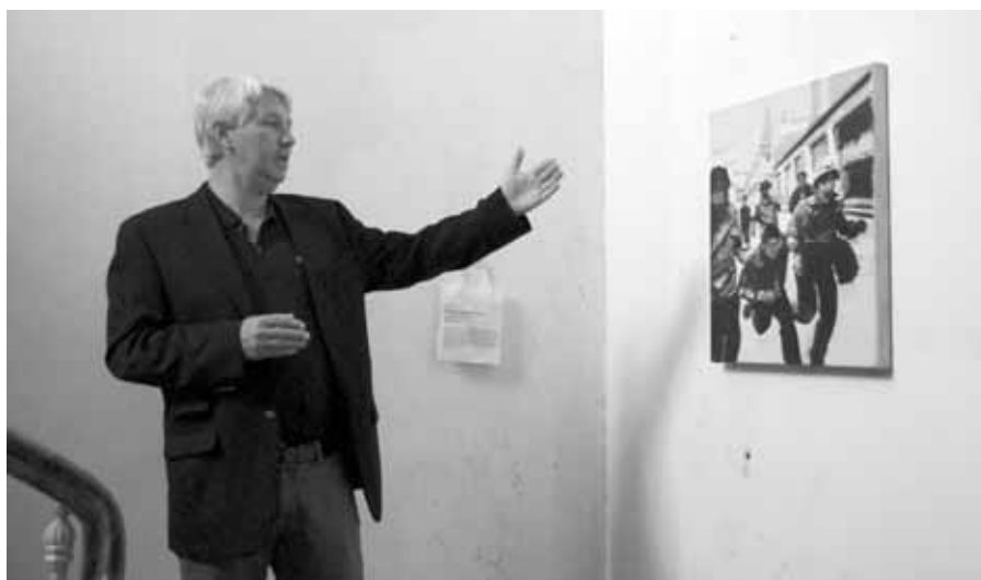
Ausstellung „QL-Tribute“.