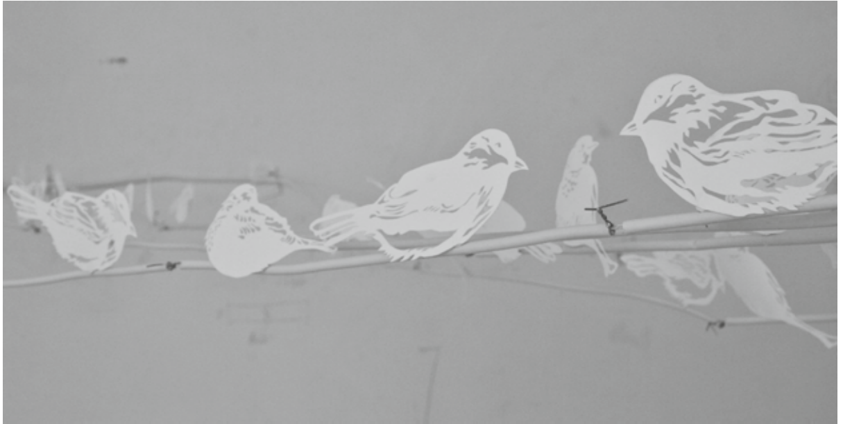
Like a -X to a- Y, Scherenschnitt-Installation, 2013, © Weinstein

das Licht wirklich außergewöhnlich gut war, und so begann ich mit den weißen Flächen zu experimentieren. Ich begann mich zunächst einfach mit einigen Möglichkeiten der Arbeit mit Papier auseinanderzusetzen und kam dann auf den Scherenschnitt. Ich fand ein Bild im Internet und so entstand der erste Soldat, dann der nächste und der nächste – und plötzlich war es eine ganze Brigade. Ich arbeitete einfach drauflos und entdeckte während der Arbeit das Potenzial, das dieses Motiv für mich enthielt. Das ist für mich sehr wichtig im künstlerischen Schaffensprozess: zuerst zeichnet die Hand und dann folgt erst der Kopf mit dem Denken! Ich wollte nicht einfach israelische und palästinensische Soldaten darstellen, ich machte eine große Bandbreite sehr unterschiedlicher Soldaten unterschiedlicher Länder, Kulturen und auch historischer Zeiten. Das entwickelte sich zu einer Art Mapping für mich. Mir geht es dabei nicht darum, Soldaten zu verurteilen. Mir geht es vielmehr um den Blickwinkel auf etwas. Manche Dinge sehen ganz anders aus von einem anderen Standpunkt und so ist es auch von einem Blickpunkt diesseits