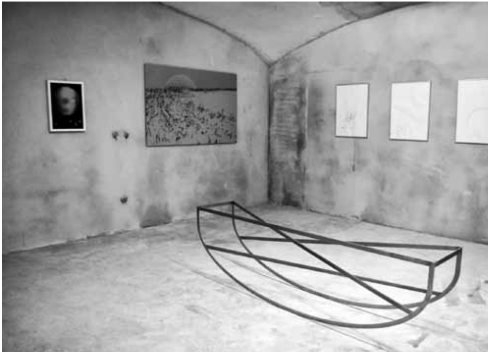
Ausstellung „QL-Tribute“.