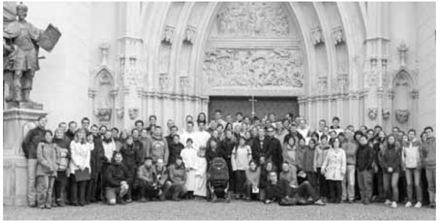
WallfahrerInnen vor der Basilika Mariazell.

Von 22. bis 26. Mai gab es Informatives und Kulturelles zum Thema: Vorträge wie etwa jener über die Bauweise