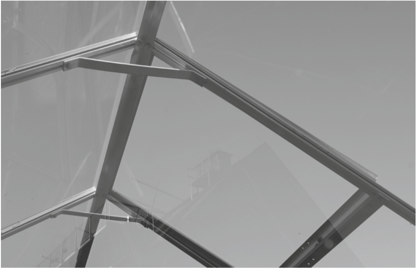
RESANITA, CAMP (Detail), 2013.

„protestantisch“. Seit dem Konzil hat sich diese konfessionell eingefärbte Diktion verändert. „Ein Wechsel in der Sprachregelung deutet meist auch auf Verschiebungen im Bewusstsein hin“. 5