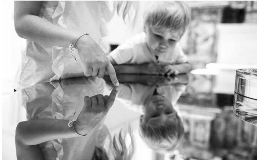
John Pawson, Perspectives (Installation in der Katharinenkirche des Grazer Mausoleums), 2011.