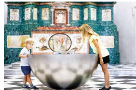
John Pawson, Perspectives (Installation in der Katharinenkirche des Grazer Mausoleums), 2011.