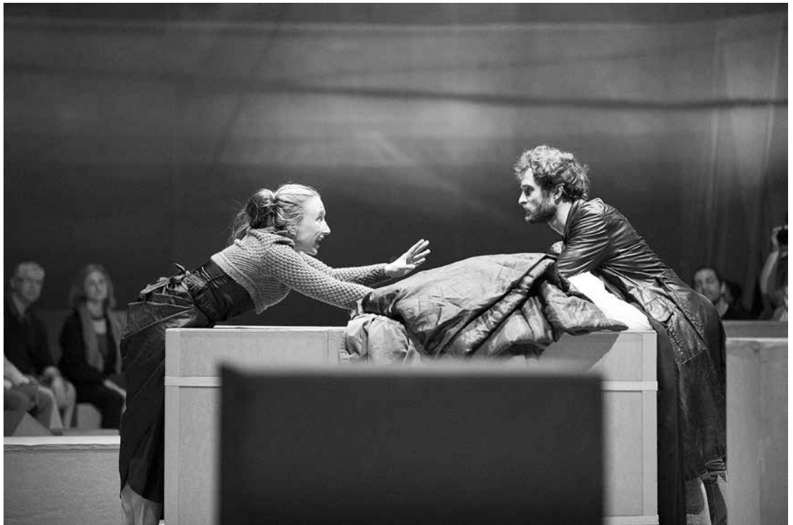
Altes Testament – Aus dem Tagebuch der Menschheit, Aufführung im Schauspielhaus Graz, 2018.

gibt. Damit ist nicht nur die römisch-katholische Kirche gemeint; gleiches lässt sich in anderen christlichen Kirchen beobachten. Dabei kann es auch überhaupt nicht verwundern, dass es die Frage nach einem Recht auf sexuelle Selbstbestimmung ist, um die es immer wieder heftige Konflikte gibt. Die Gründe hierfür sind teils historischer Natur. Mehr noch aber dürfte sich auf diesem Konfliktfeld das Ringen um das Recht einer normativen Moderne bemerkbar machen. Mit diesem Begriff soll dreierlei bezeichnet werden: Erstens setzt eine solche Moderne keine religiöse Grundlage voraus, sondern sie begründet sich aus sich selbst heraus. Sie ist zwar alles andere als religionslos, aber: Ihre rechtliche Grundlage bildet sie säkular, d. h. allein durch diskursive Prozesse und geregelte Verfahren organisierter Mehrheitsentscheidungen, aus. Zweitens garantiert eine solche Moderne individuelle Freiheitsrechte in den Grenzen des existierenden Rechts. Ihre moralisch-sittliche Substanz kann eine solche Moderne freilich nicht rechtlich erzwingen. Dafür, dass diese sich immer wieder erneuert, ist sie auf die Individuen und zivilgesellschaftliche Akteurinnen und Akteure angewiesen. Was bedeutet das für die Kirchen?