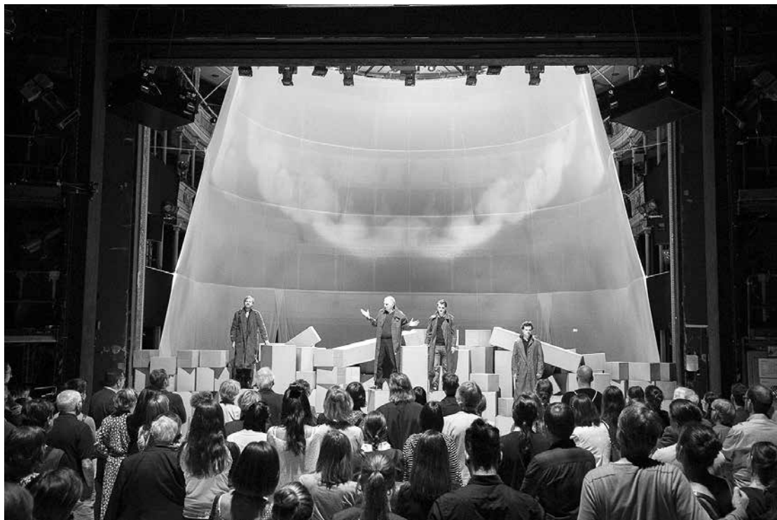
Altes Testament – Aus dem Tagebuch der Menschheit, Aufführung im Schauspielhaus Graz, 2018.

und Konzepte, mittels derer sie sich organisieren und aus denen heraus sie leben, menschengemacht sind, ist, dass auch immer Macht im Spiel war, die diese durchgesetzt hat und bis heute stabilisiert. Dann aber sind sie auch zu kontrollieren, immer wieder neu der Frage auszusetzen, ob sie auch weiterhin gelten sollen. Denn eines wird man nur schwerlich bestreiten können: Dass unendlich viele Menschen bereits verletzt, ja, vernichtet wurden, weil sie sich nicht in die herrschenden Vorstellungen fügten. Macht ist immer im Spiel. Deshalb ist die Frage, ob man dies anerkennt – und ob man sich in der Ausübung von Macht kritisch kontrolliert. Das aber hat zur Voraussetzung, dass man sich auf diskursive Prozesse einlässt und sich der Kraft des besseren Arguments überlässt. Ist aber Freiheit das Höchste, dann findet jedes Argument hier sein mögliches Korrektiv.