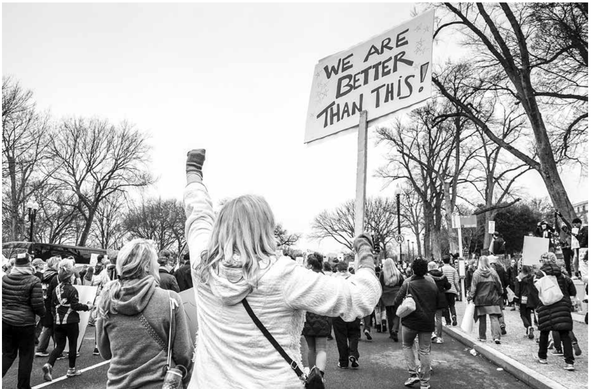
we are better.

Eine Gesellschaft lässt sich definieren als ein komplexes Gefüge und Zusammenspiel von in Gemeinschaft lebenden Menschen, das durch Rechtsregeln, Verhaltensmuster und unterschiedliche Erwartungshaltungen bestimmt ist. Dies bedeutet, sich an Gesetze und Normen anzupassen, verschiedenste Regeln einzuhalten. Zwischen Individuen gibt es dabei ein Geflecht aus diversen sozialen Zusammenhängen, aufgrund derer sich Gruppen bzw. Gemeinschaften konstituieren. Das Individuum kann also als kleinste Einheit der Gesellschaft verstanden werden, baut das Zusammenleben in Gesellschaften doch auf ihm auf.